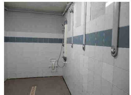
Vestiaires et douche