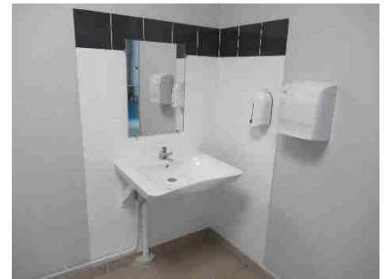
Sanitaires PMR Public