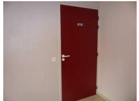
Sanitaires PMR Public