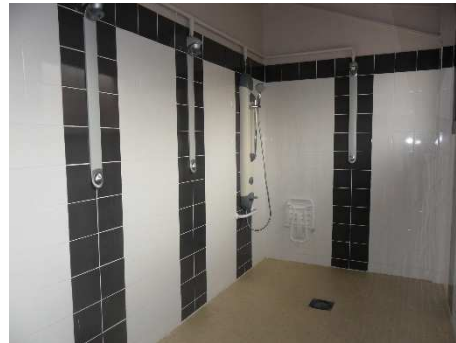
Vestiaires et douches