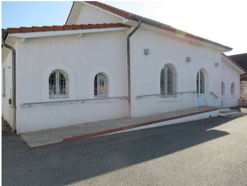
Cheminement pente < 5%