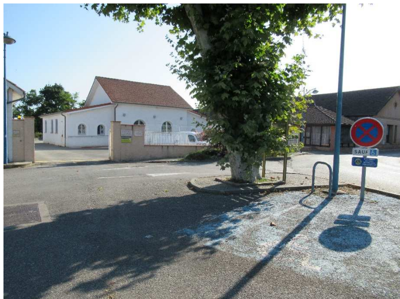
Parking réservé au public