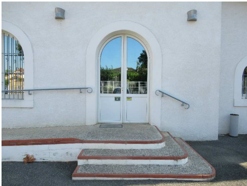
Seuil sans ressaut