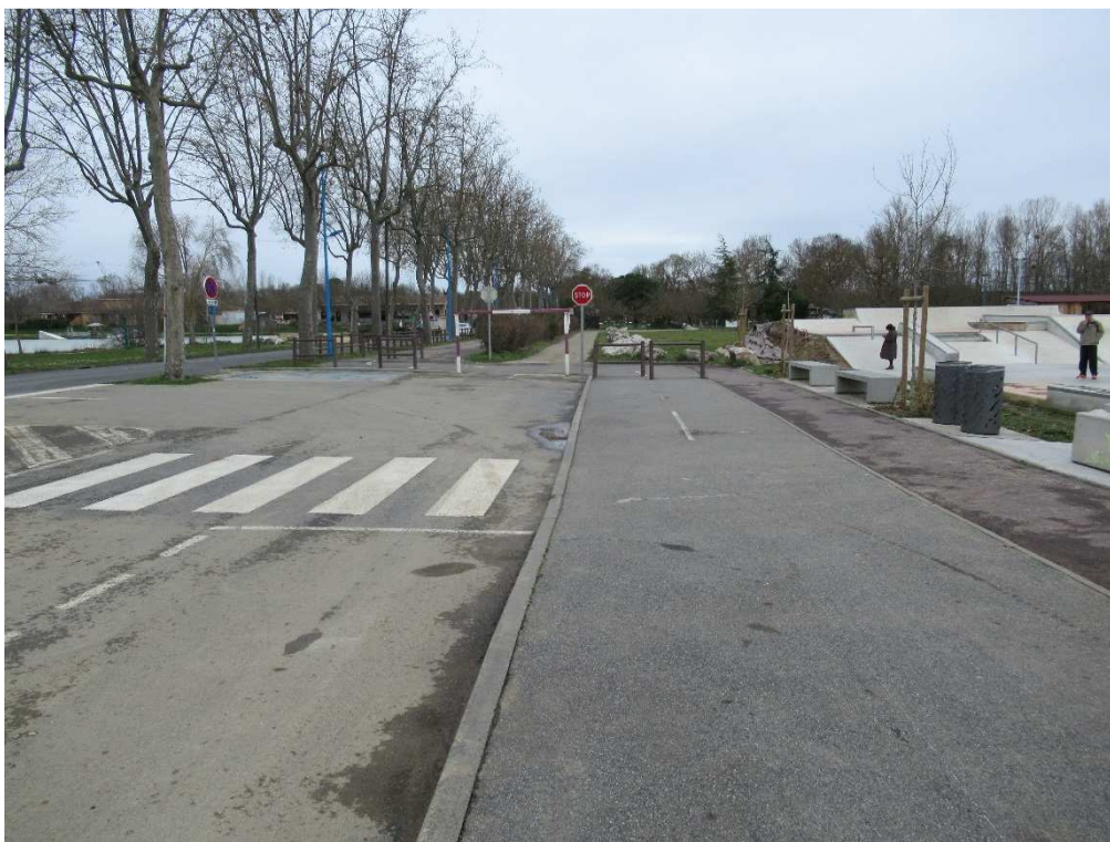
Parking PMR et cheminement